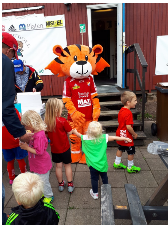
Mascoten Bore har blivit en populär gäst vid vår Fotbollslek